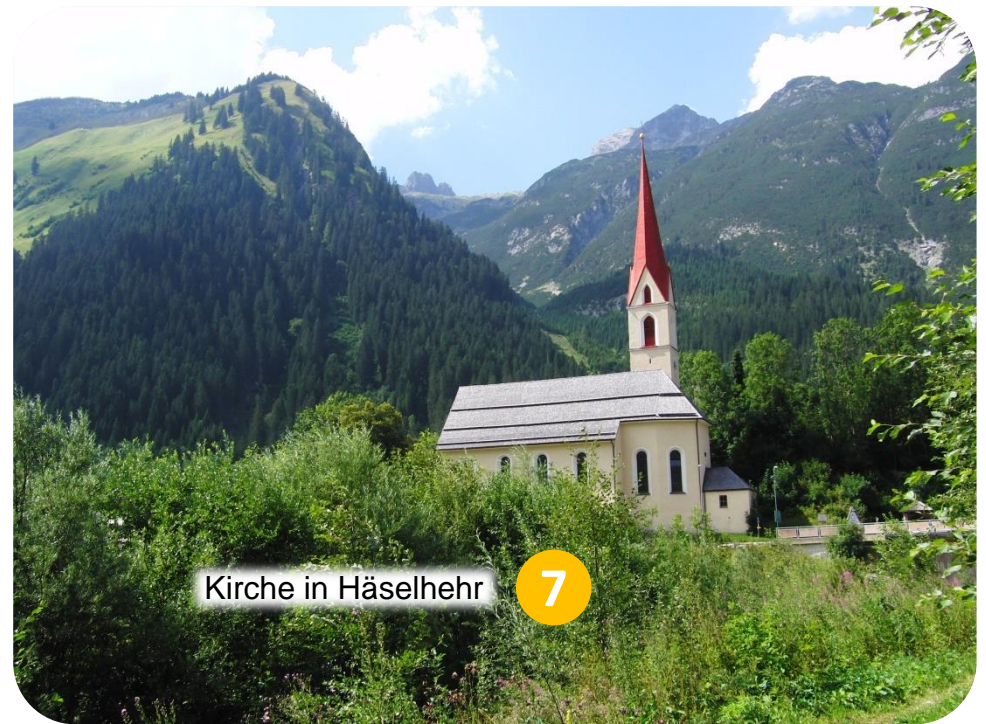
Kirche in Häselhehr