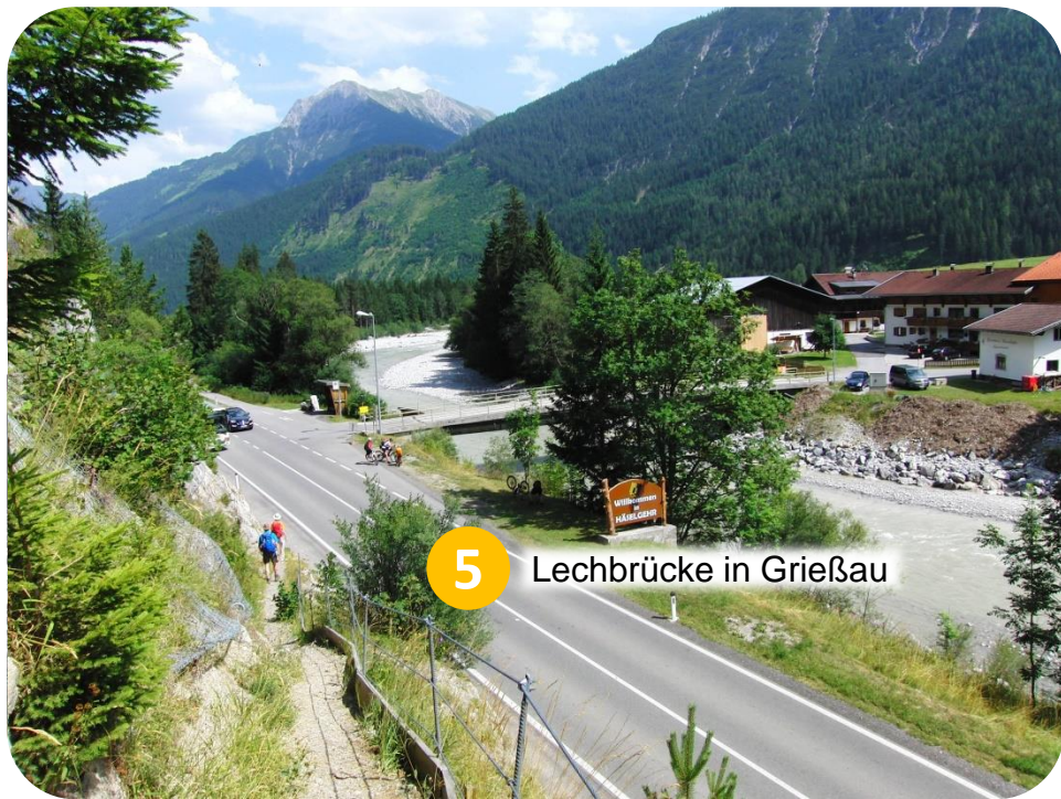
5 Lechbrücke in Grießau