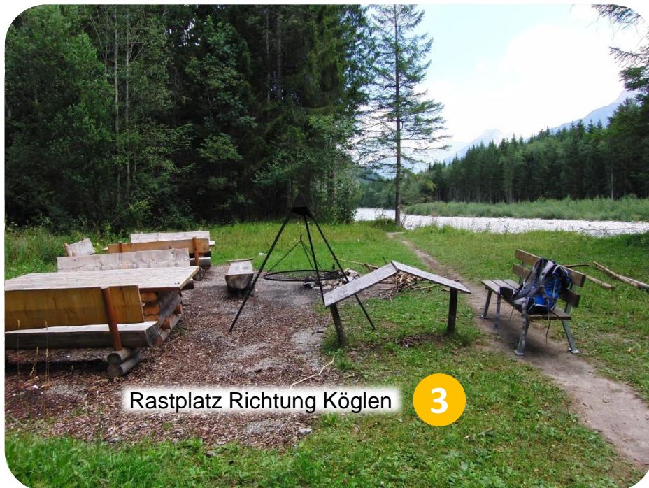
Rastplatz Richtung Köglen