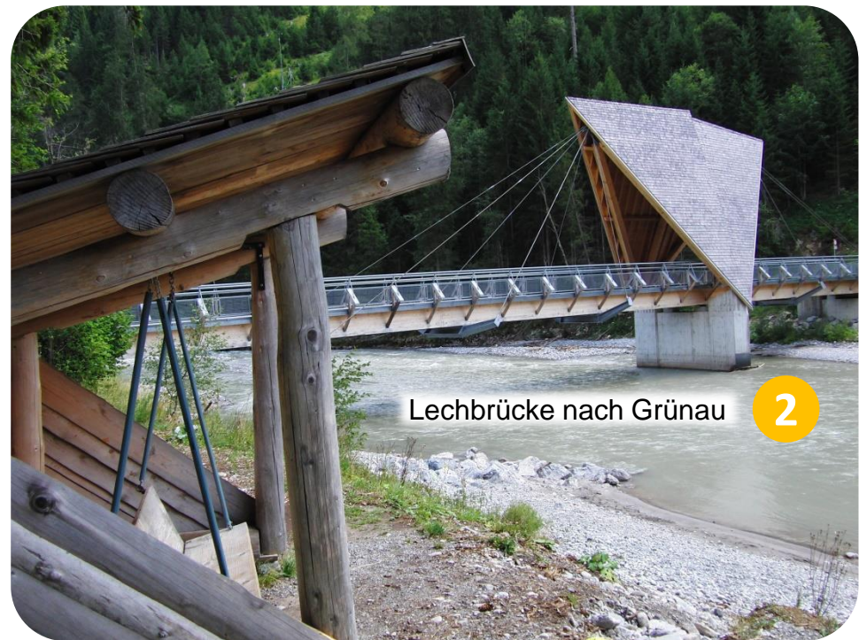
Lechbrücke nach Grünau