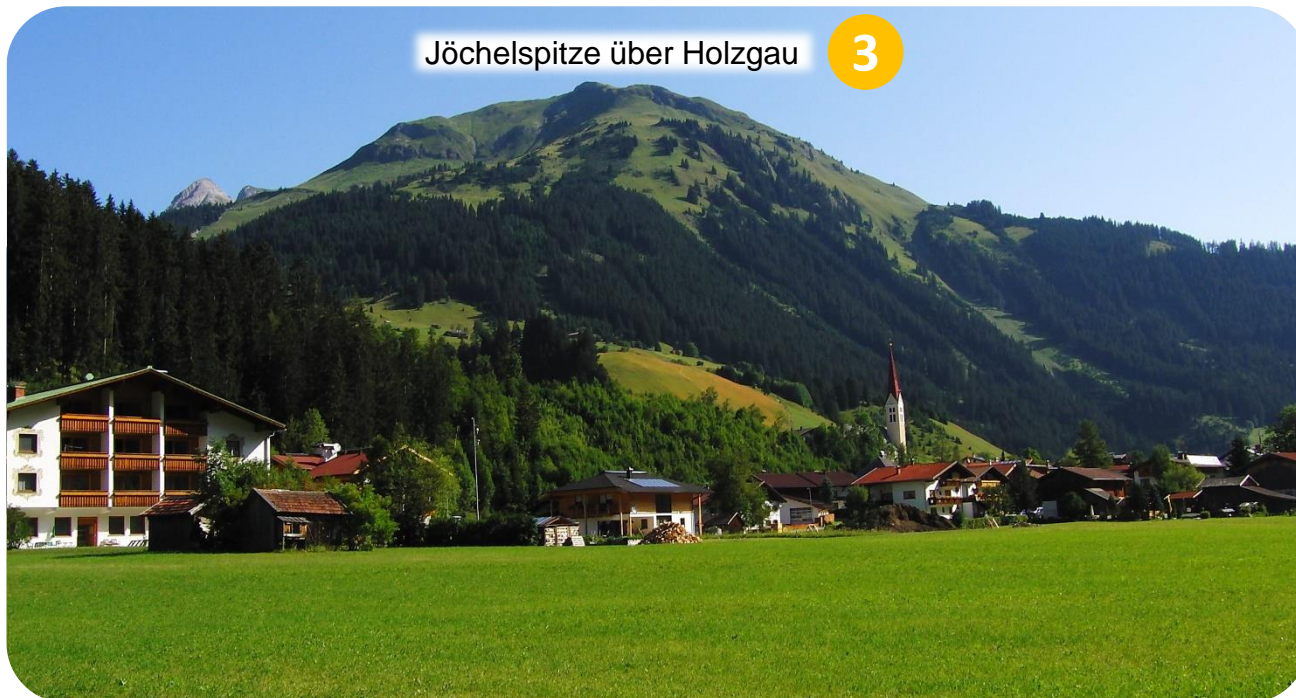
Jöchelspitze über Holzgau