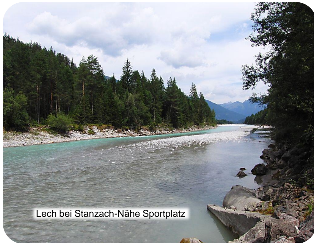
Lech bei Stanzach-Nähe Sportplatz