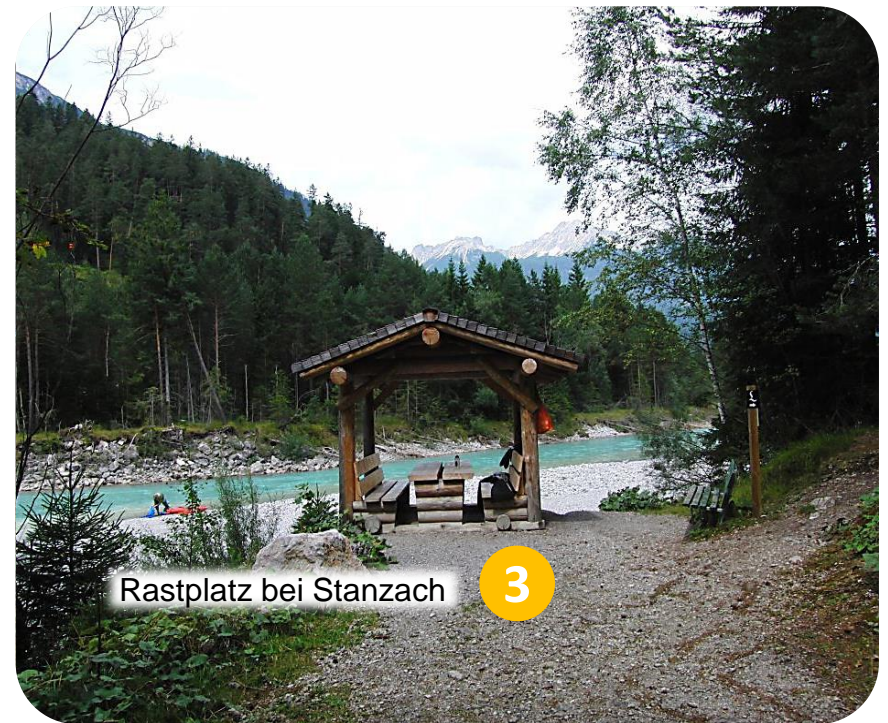
Rastplatz bei Stanzach