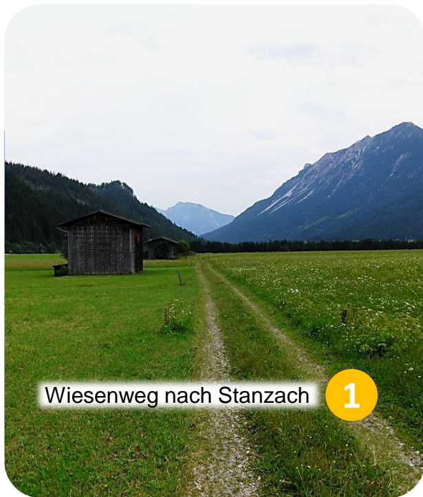
Wiesenweg nach Stanzach