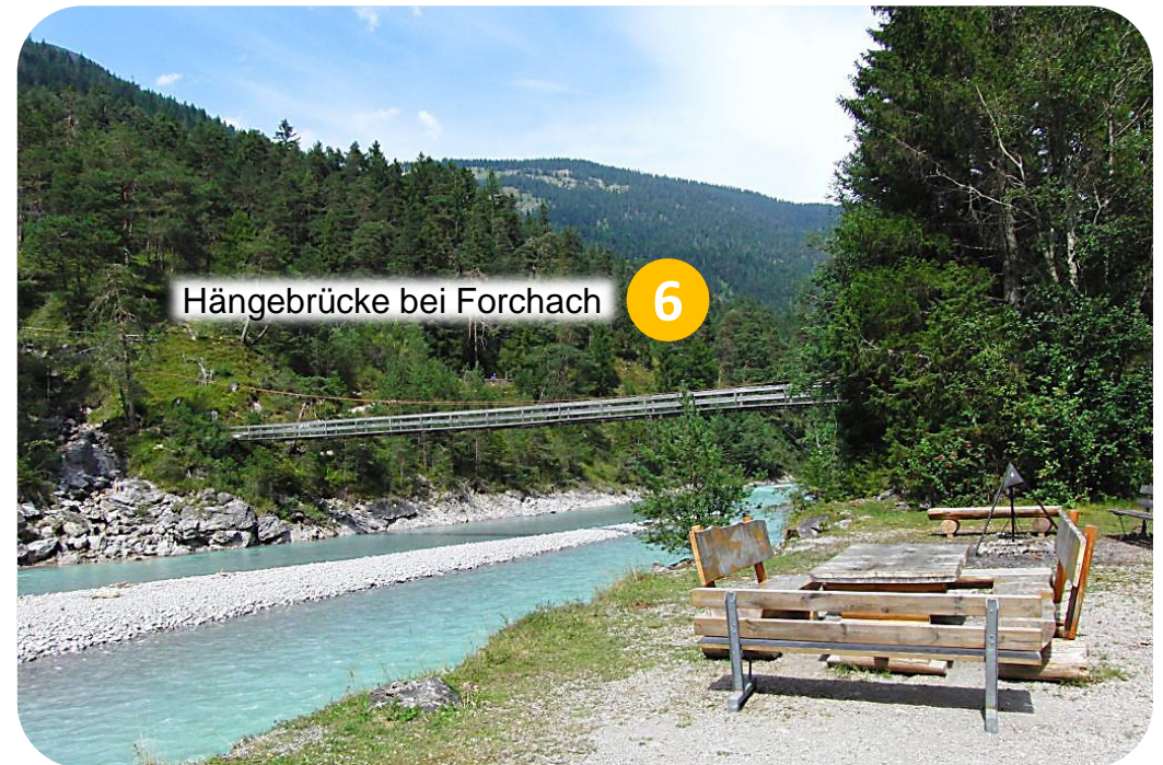
Hängebrücke bei Forchach