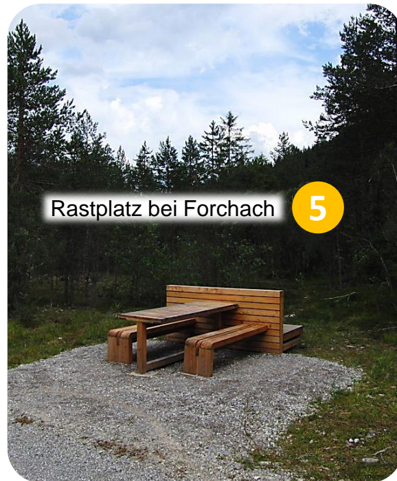
Rastplatz bei Forchach