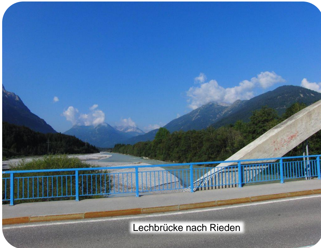
Lechbrücke nach Rieden