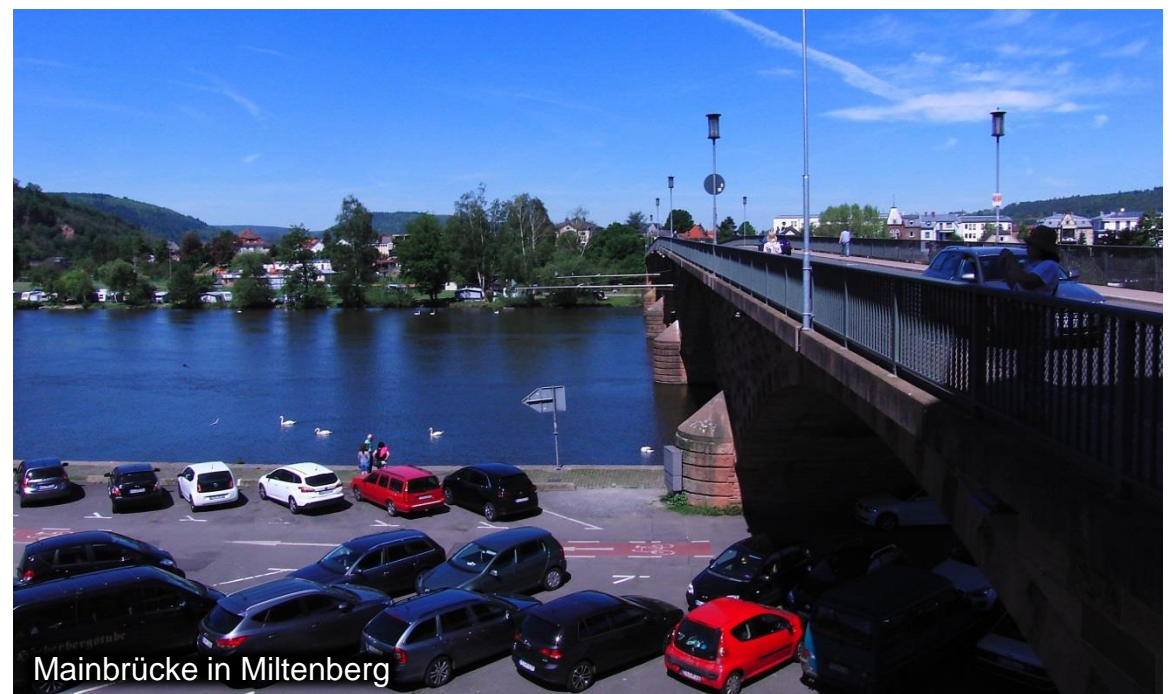
Mainbrücke in Miltenberg