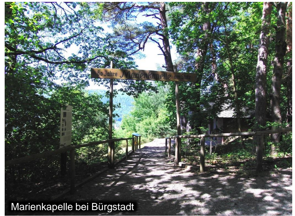
Marienkapelle bei Bürgstadt