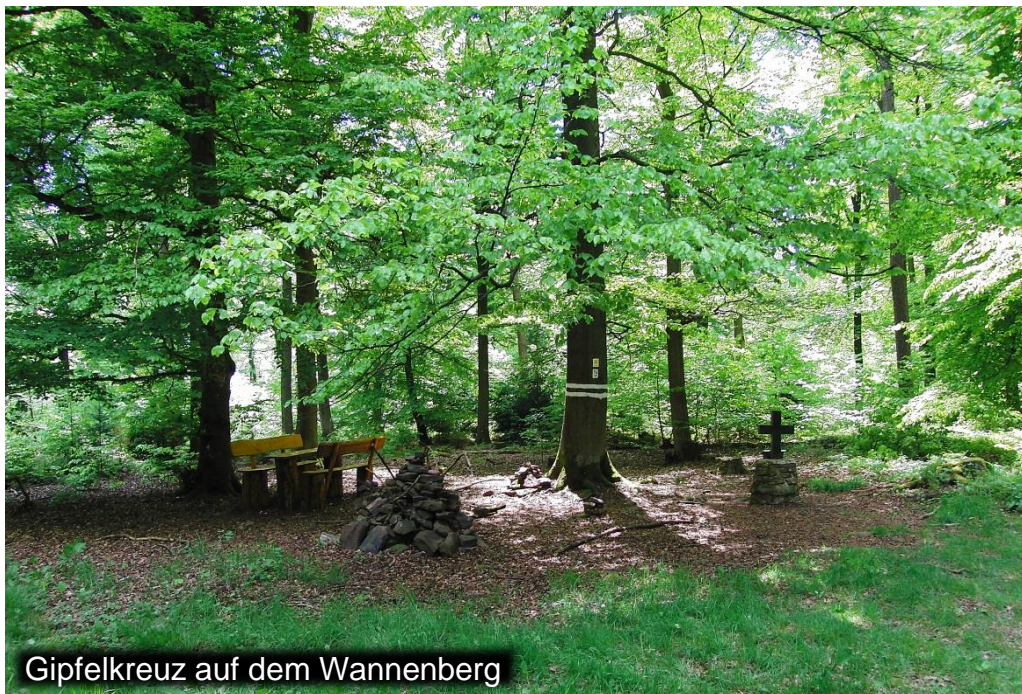
Gipfelkreuz auf dem Wannenberg