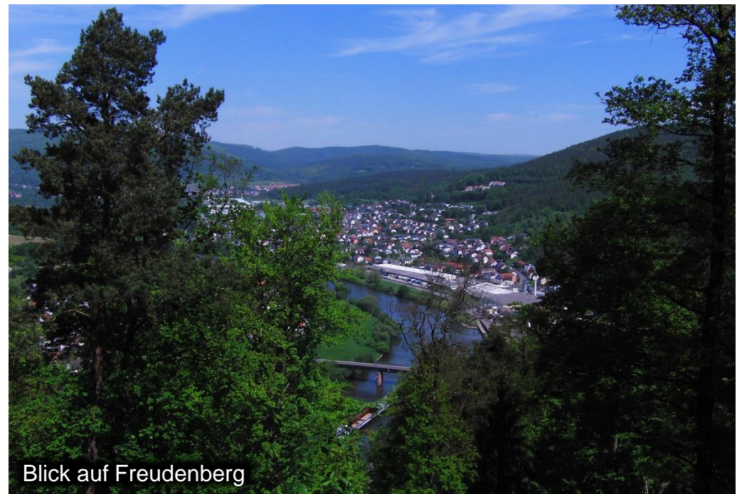
Blick auf Freudenberg