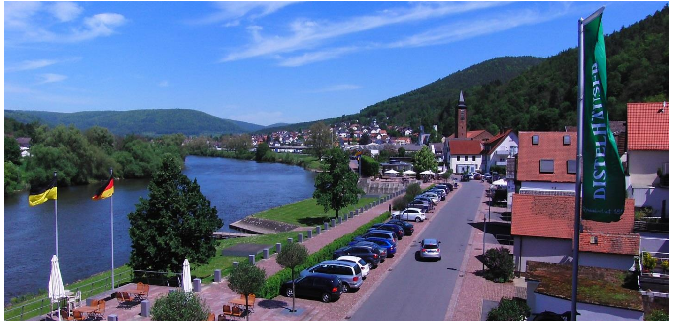
Freudenberg am Main