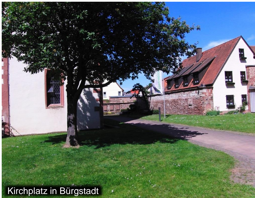
Kirchplatz in Bürgstadt