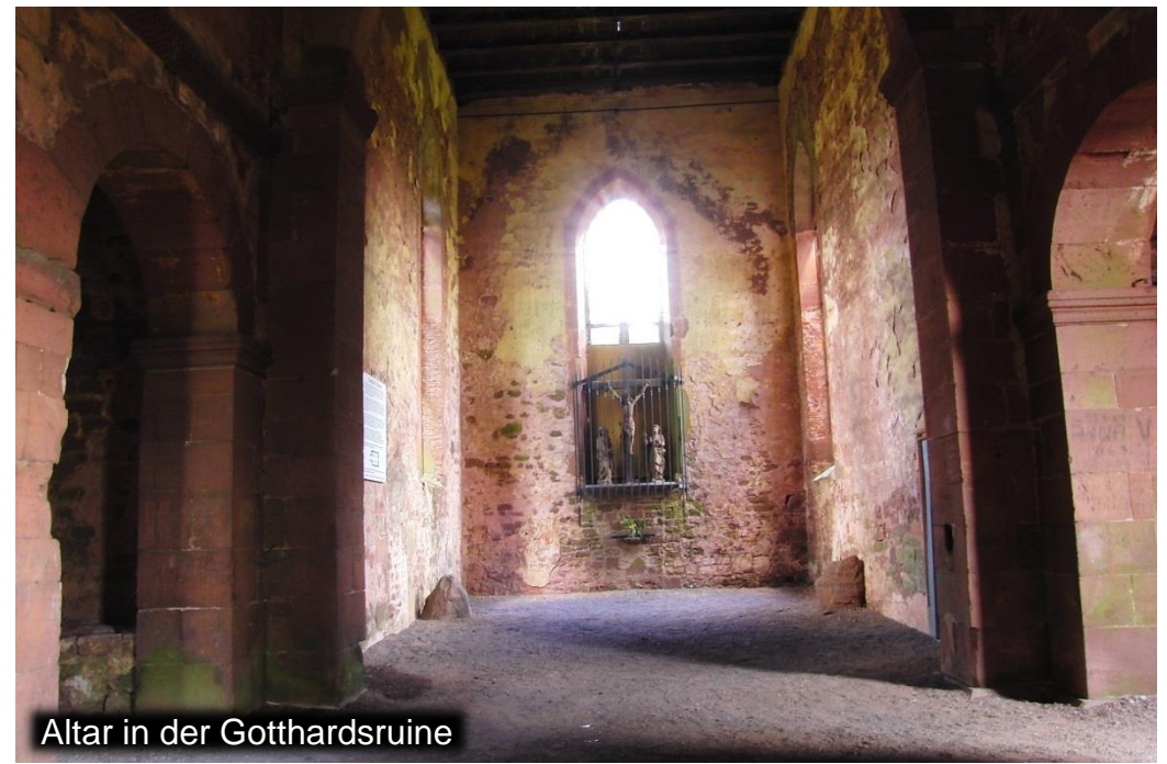
Altar in der Gotthardsruine