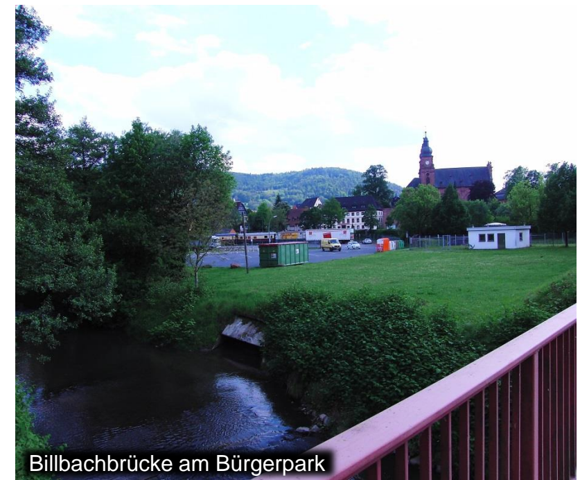
Billbachbrücke am Bürgerpark