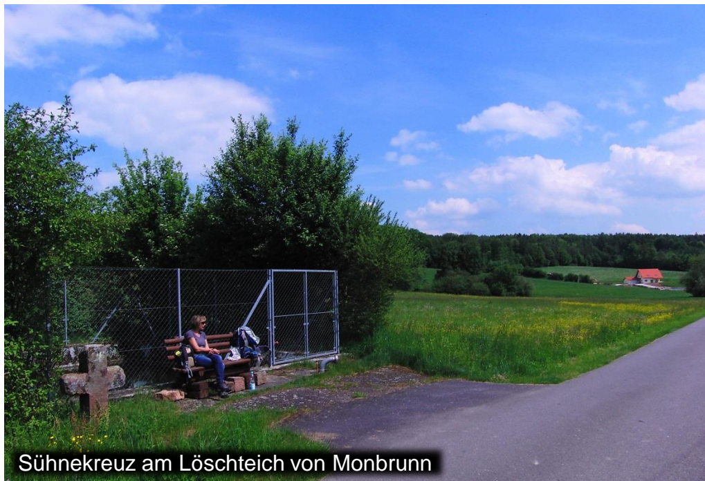
Sühnekreuz am Löschteich von Monbrunn