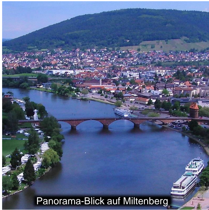
Panorama-Blick auf Miltenberg