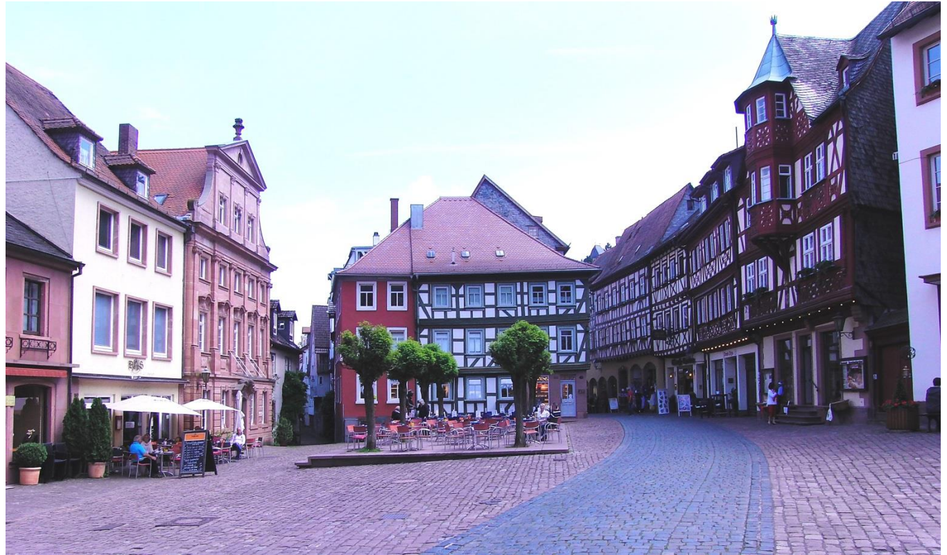
Altstadt von Miltenberg