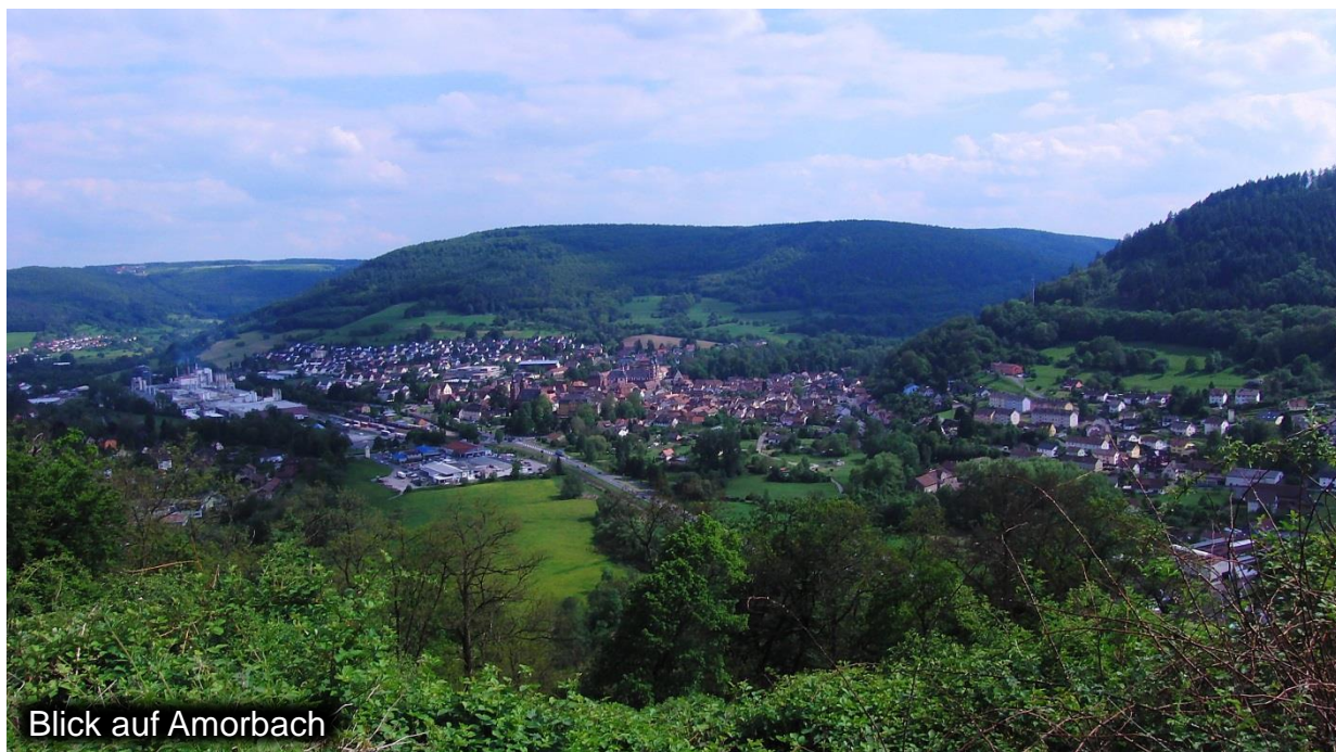
Blick auf Amorbach