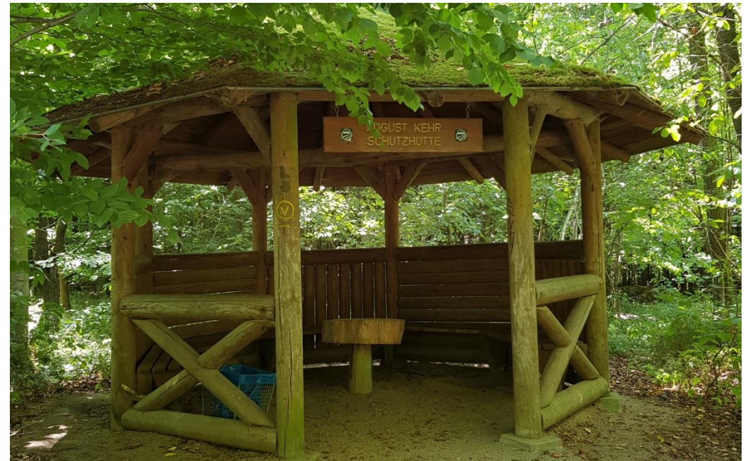
August Kehr Schutzhütte