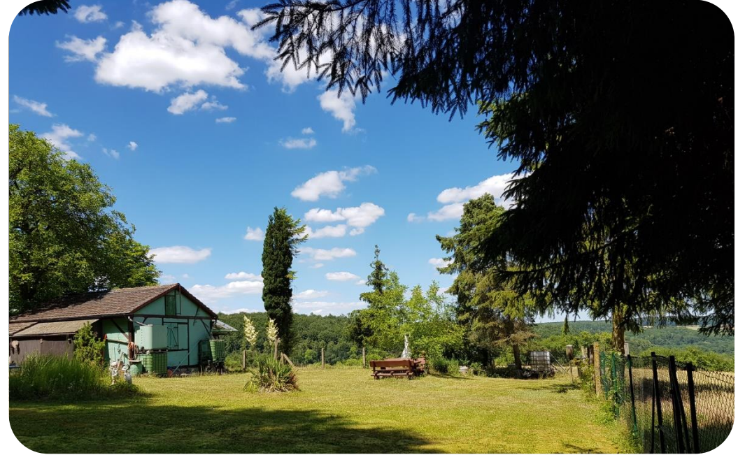
Privatgrundstück am Waldrand