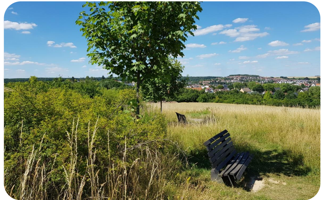
Ruhebänke Richtung Stausee