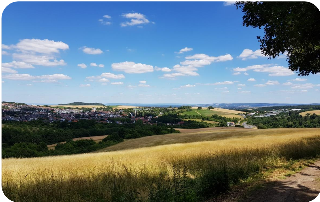
Panorama am Naturfreundehaus