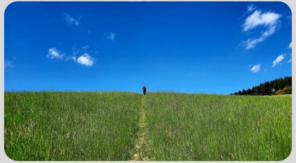
Aufstieg vom Büdlicherbachtal