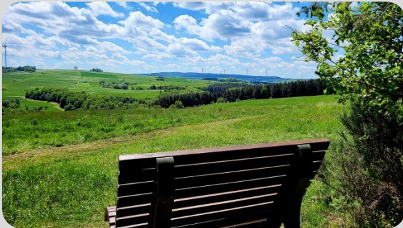
Panorama vom Waldrand