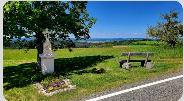
Andachtsstätte an der K 138