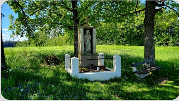
Andachtsstätte an der K 76