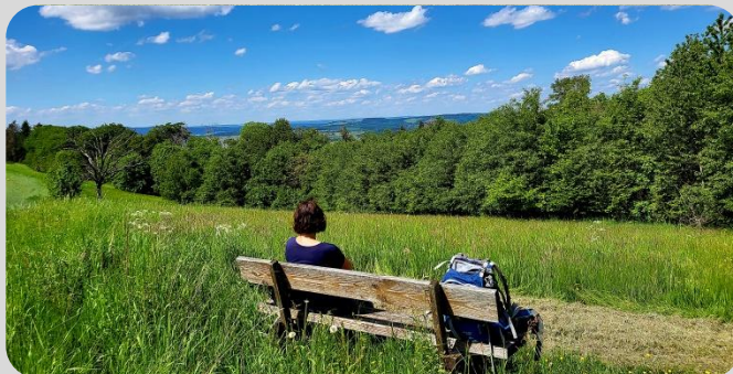
Rast Richtung Campingplatz zurück