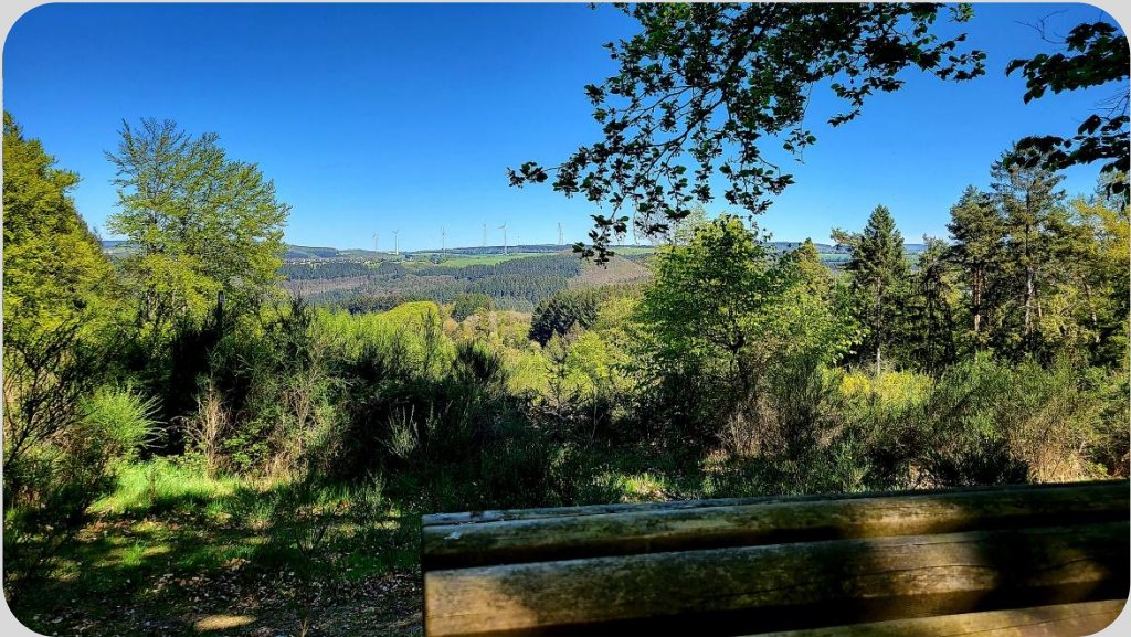
Panoramabank im Wald