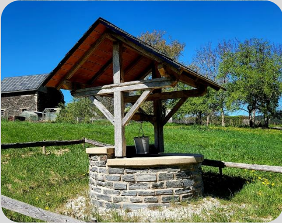
Brunnen in Unternaurath