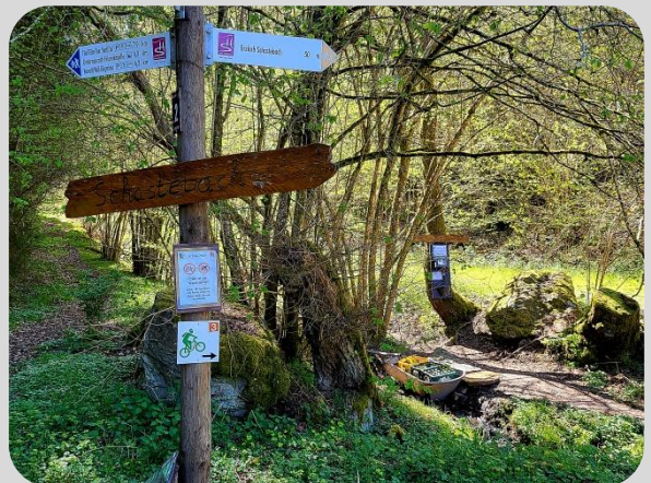
Rastplatz am „Erdloch Schastebach“