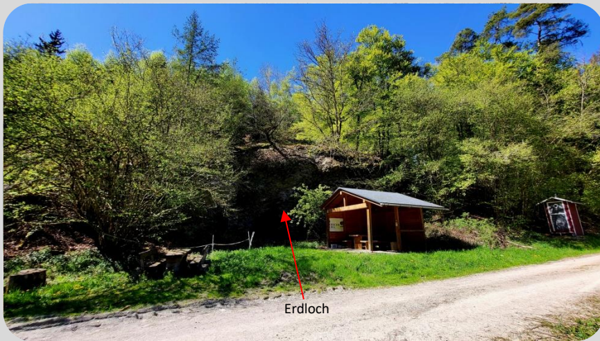
„Erdloch Schastebach“ mit Rastplatz