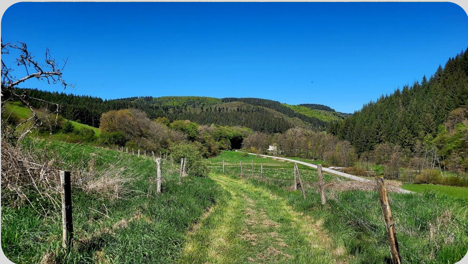
Blick zum Rüssels Landhaus