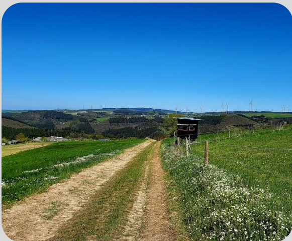
Weg nach Naurath