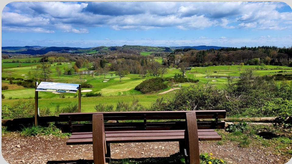
Rastplatz am Golfpark