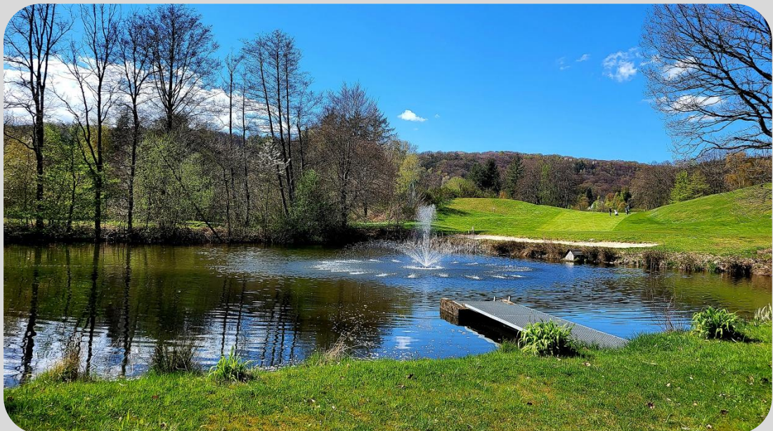
am Restaurant Weiherhof