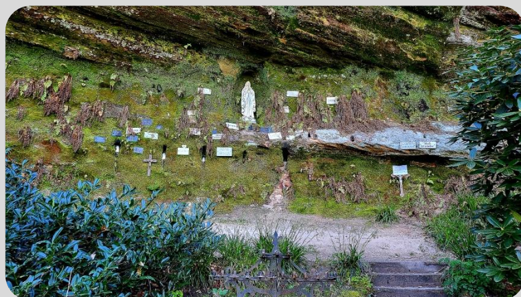
„Lourdesgrotte am Rammenfels“