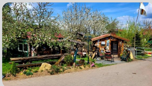
Biohof Wacht in Fisch