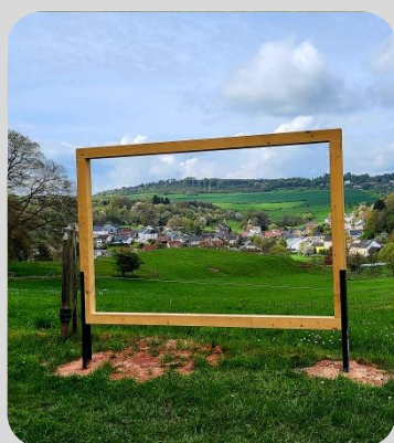
Blick nach Mannebach