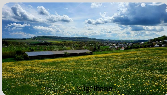
Kugelbahn Blick nach Fisch