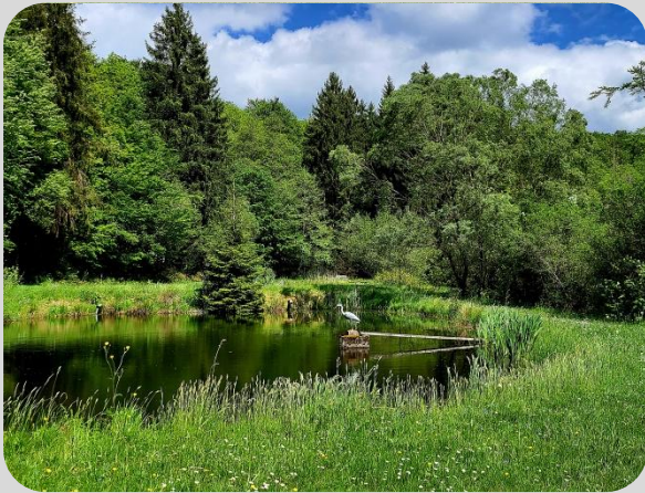
Weiheranlage im Saarhölzbachtal