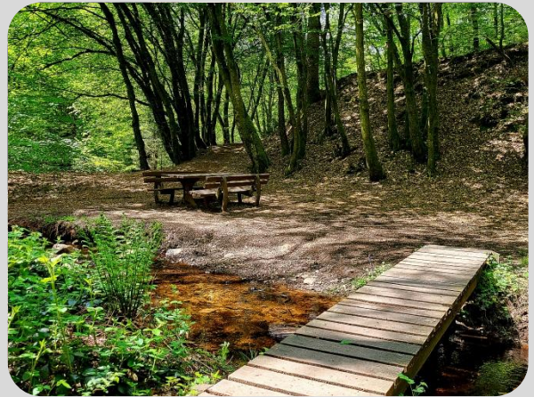
Rastplatz im Saarhölzbachtal