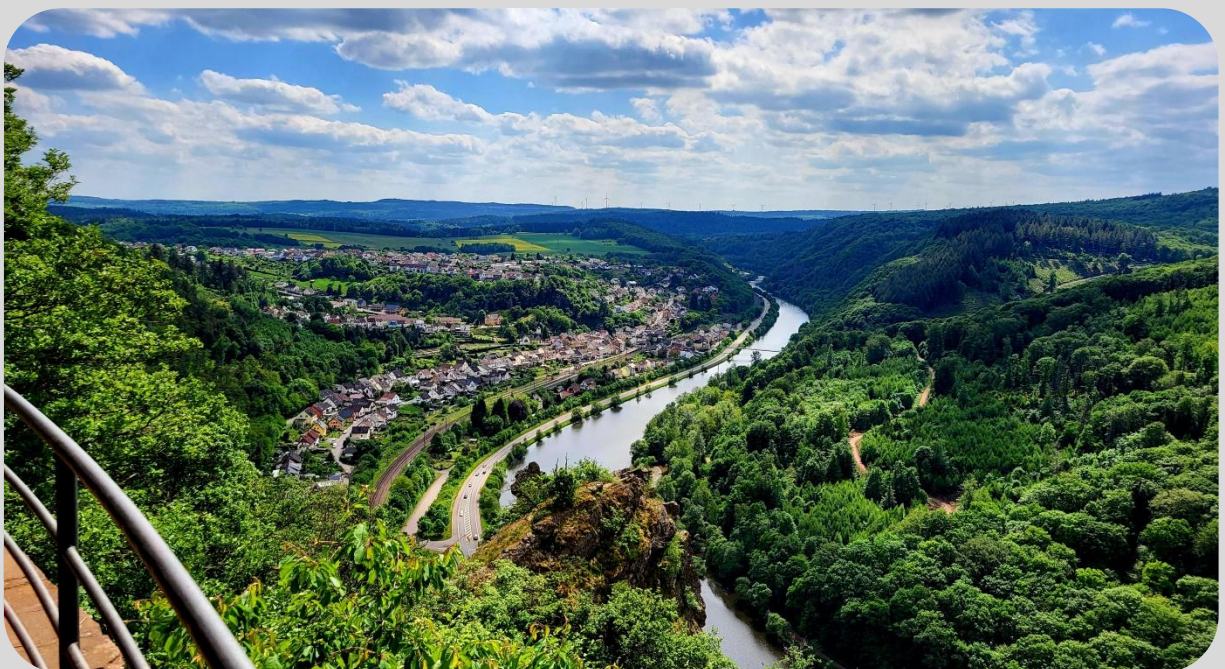
Blick über den Vogelfelsen nach Saarhölzbach